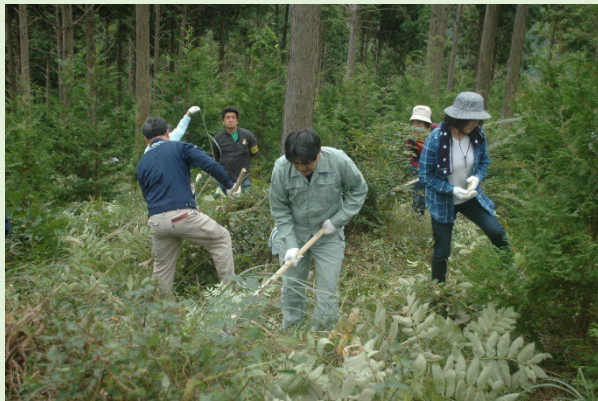
▲西部の森さくち活動の様様